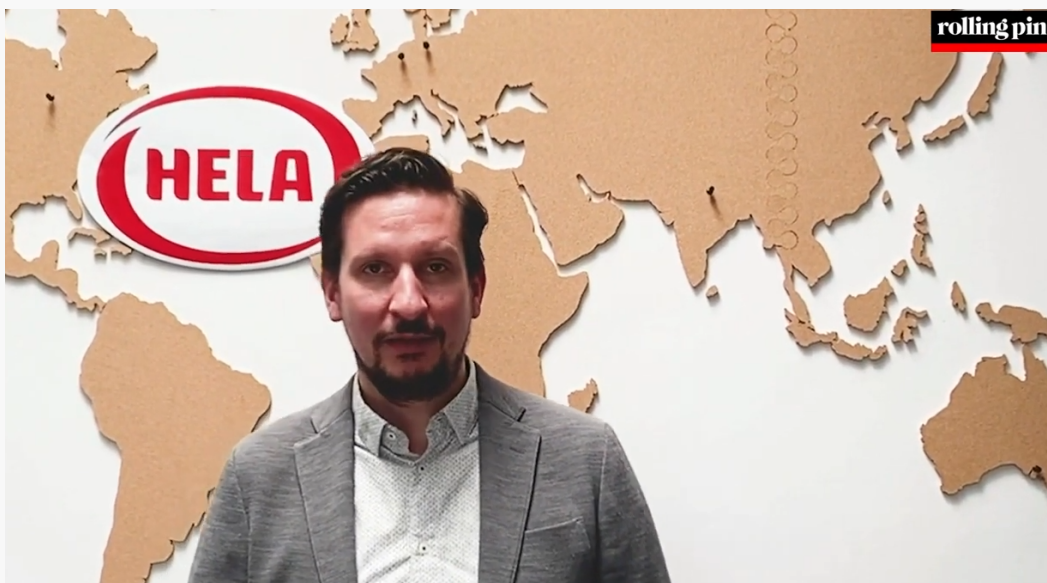
Abbildung 7: Grußwort von „HELA“ nach ca. 16 Minuten

Ab ca. Minute 16:00 wird ein Grußwort des Unternehmens „HELA“ ausgestrahlt (siehe Abbildung 7). In diesem verweist der Vertreter des Unternehmens unter anderem auf „unsere unfassbar tollen gerösteten Currys“.