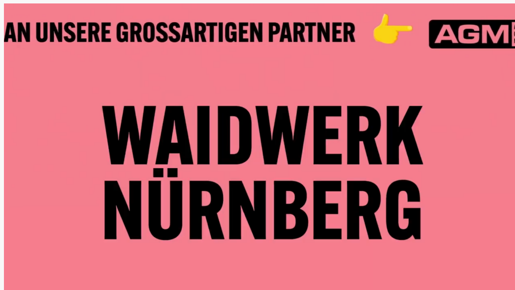
Abbildung 2: Einblendung „[Danke...] an unsere großartigen Partner“ nach ca. 1 Minute und 40 Sekunden

Am Ende einer Schleife ist der folgende Satz angebracht: „Danke [...] an unsere grossartigen Partner“ (siehe Abbildung 2). Dieser ist erstmals nach ca. 1 Minute und 38 Sekunden zu sehen.