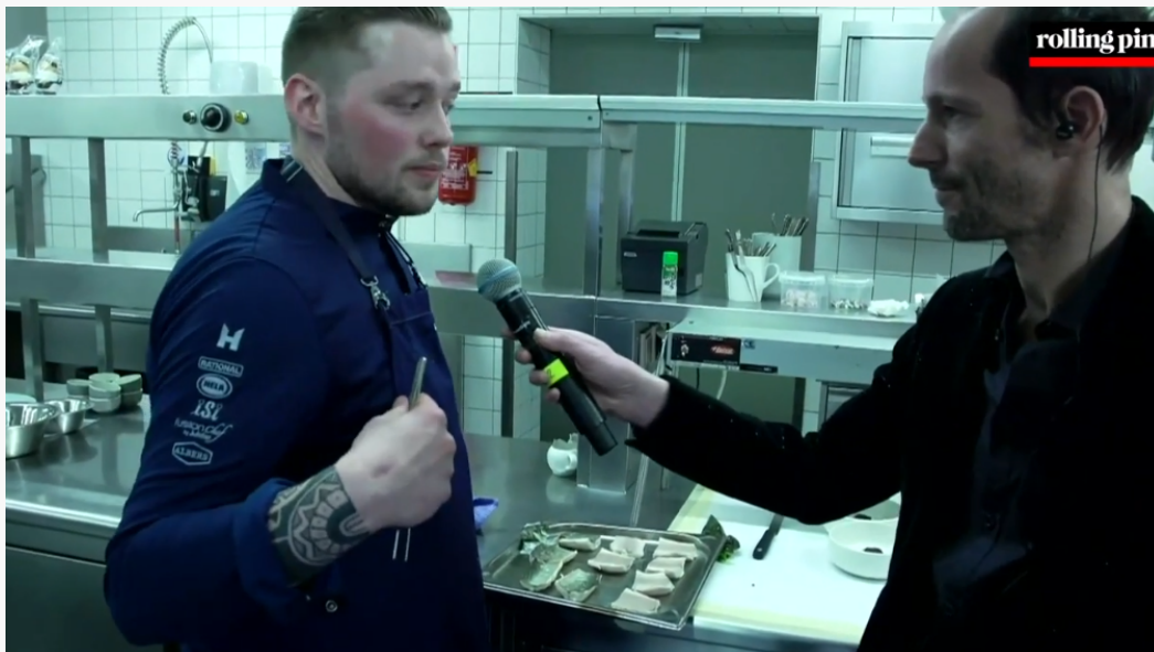
Abbildung 4: Kochgarnitur mit Logos nach ca. 27 Minuten und 26 Sekunden

Nach ca. 27 Minuten und 26 Sekunden wird ein Interview mit einem der Kandidaten des Kochwettbewerbs übertragen. Auf dessen Kochgarnitur sind dabei Logos der Unternehmen „RATIONAL“, „HELA“, „iSi“, „Julabo“ und „Albers“ zu erkennen (siehe Abbildung 4). Ähnliche Interviews, bei denen die angeführten Logos sowie die Logos von anderen in der „Logoschleife“ (siehe Abbildung 1) enthaltenen Unternehmen auf den Garnituren der Interviewpartner erkennbar sind, werden während der gesamten Sendungsdauer ausgestrahlt.