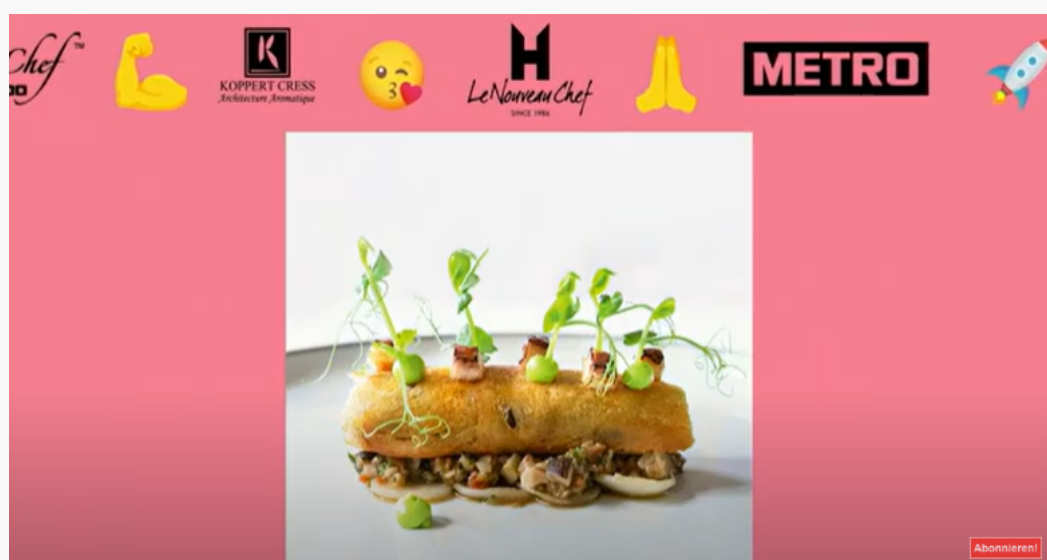
Abbildung 1: Logoschleife zu Beginn der Sendung „Junge Wilde 2020 – das Finale“

Am 29.11.2023 wird in dem unter der URL https://www.youtube.com/@ROLLINGPINTV abrufbaren audiovisuellen Mediendienst auf Abruf „Rolling Pin“ der Rolling Pin Media GmbH die Sendung „Junge Wilde 2020 – das Finale“ zum Abruf bereitgehalten.