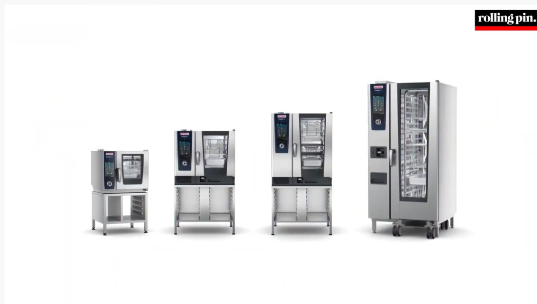
Abbildung 8: Werbespot für „RATIONAL“ nach ca. 2 Stunden und 14 Minuten

Die Sendung wird zu folgenden Zeiten durch die Einspielung von Werbespots unterbrochen: Von Minute ca. 26:30 bis ca. 26:57 für einen Spot für „THALHEIM“, von ca. Minute 48:55 bis ca. 50:33 für einen Spot für „Jack’s Creek“, von Minute ca. 1:26:50 bis ca. 1:29:18 für einen Spot für „RIST“, von ca. Minute 1:55:05 bis ca. 1:55:32 für einen Spot für „Le Nouveau Chef“, von ca. Minute 2:05:14 bis ca. 2:06:52 für einen Spot für „Julabo“, von ca. Minute 2:15:23 bis ca. 2:16:34 für einen Spot für „RATIONAL“ (siehe Abbildung 8), von ca. Minute 2:17:21 bis ca. 2:17:41 für einen Spot für „DICK“ und von ca. Minute 2:31:13 bis ca. 2:32:13 für einen Spot für „METRO“.