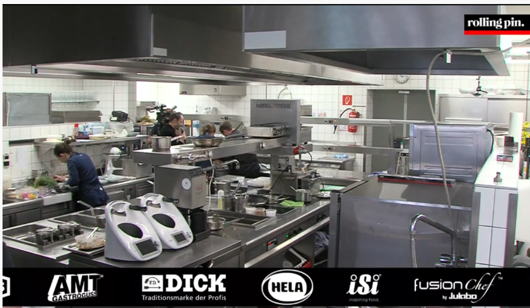
Abbildung 5: Logoschleife nach ca. 30 Minuten und 5 Sekunden

Wiederholt, etwa nach ca. 30 Minuten und 5 Sekunden und ca. 2 Stunden 42 Minuten und 57 Sekunden, werden zusätzlich zu dem Sendungsinhalt des Kochwettbewerbs die Logos der bereits in der Logoschleife zu Sendungsbeginn enthaltenen Unternehmen auf einem schwarzen Streifen über den unteren Teil des Bildes gezogen (siehe Abbildungen 5 und 6).