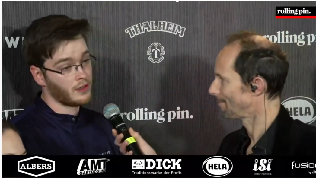
Abbildung 6: Logoschleife nach ca. 2 Stunden 42 Minuten und 57 Sekunden

In der Sendung werden verschiedene zuvor aufgenommene Grußworte von Unternehmen ausgestrahlt. Diese Grußworte werden jeweils von den Moderatoren angekündigt und die Unternehmen als „Partner“ bezeichnet, so etwa nach ca. 1 Stunde 54 Minuten und 44 Sekunden („... und zwar haben wir jetzt wieder einen fantastischen Partner vorzustellen“).