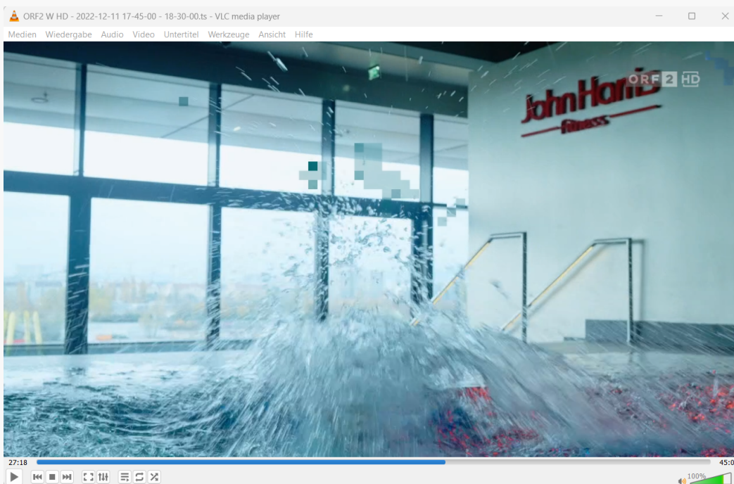
Abbildung 3: Logo „John Harris Fitness“ um ca. 18:12:33 Uhr