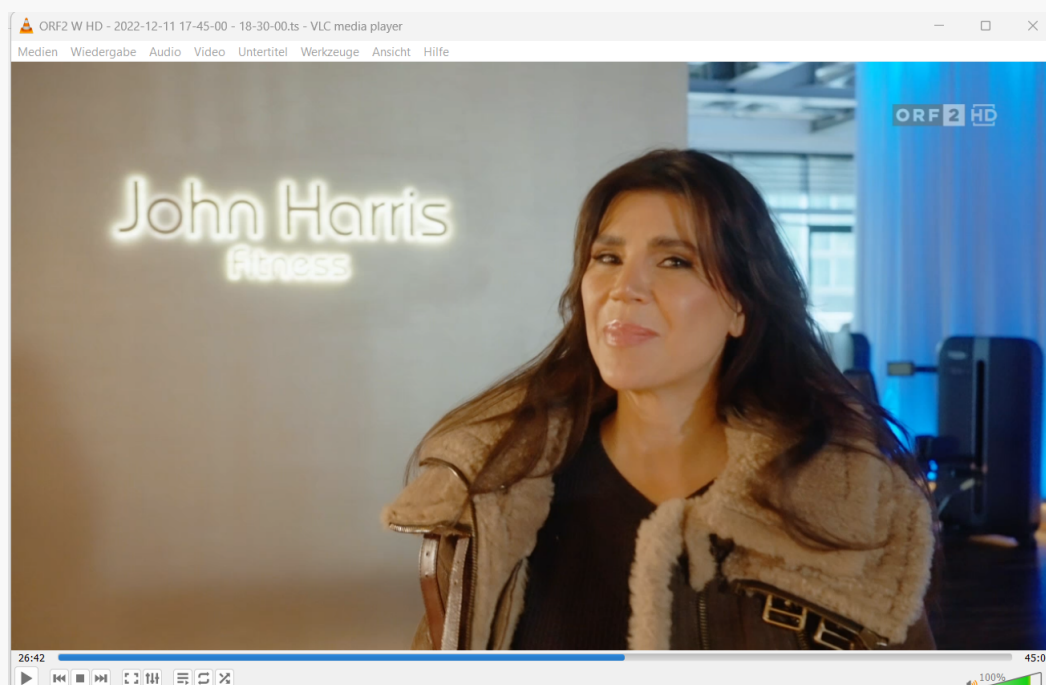
Abbildung 1: Logo von „John Harris“ um ca. 18:11:41 Uhr