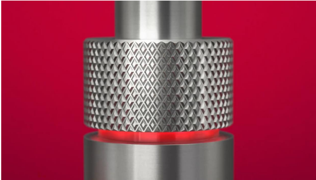
Abbildung 1: Beginn des Sponsorhinweises für „Quooker“

Um ca. 19:21:00 Uhr und damit knapp drei Sekunden nach Beginn des Sponsorhinweises wird im Bild das Wort „Werbung“ in der linken unteren Ecke des Bildes eingeblendet, sowie die Marke des beworbenen Produktes „Quooker“ in der rechten oberen Ecke. Im Bild wird die vielfältige Funktionsweise des Wasserhahns dargestellt und mit Einblendungen hervorgehoben (etwa: „100°C kochendes“ – „gekühltes prickelndes“).