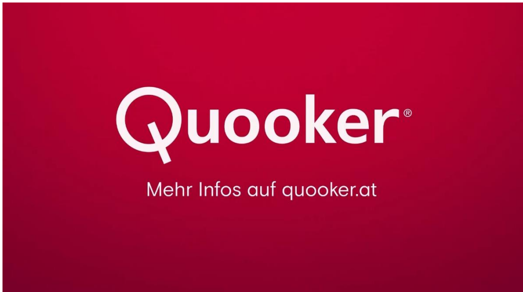
Abbildung 3: Einblendung am Ende des Sponsorhinweises von „Quooker“

Unmittelbar anschließend folgt ein Programmhinweis.