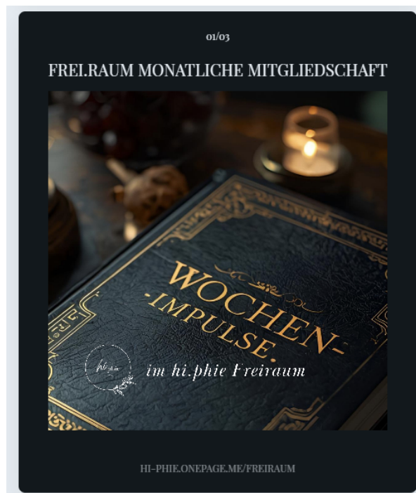
Abbildung 2 – Linktree zu „Frei.raum“