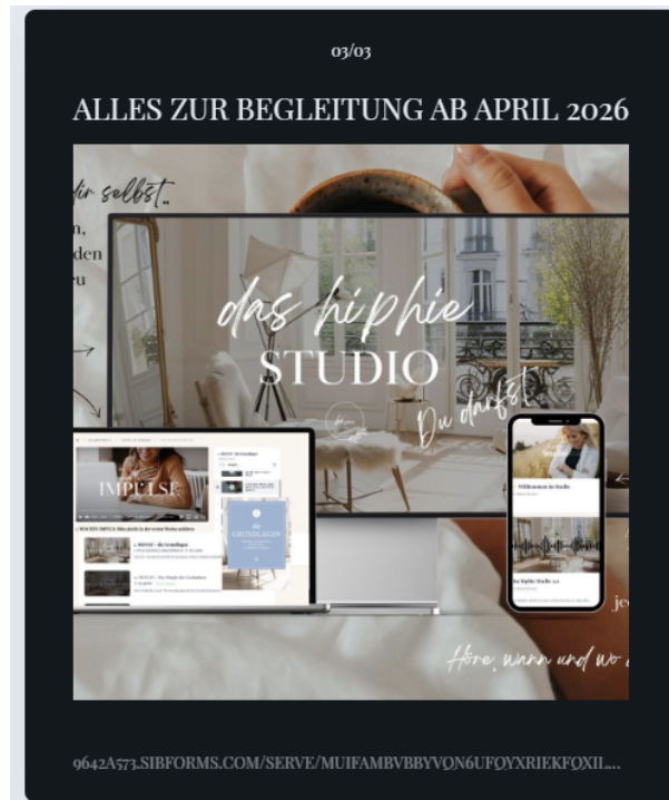
Abbildung 3 – Linktree zu „Studio“

Die KommAustria wurde im Zuge der Einsicht auf diversen Plattformen auf diesen Kanal aufmerksam. Die Einsichtnahme hat ergeben, dass der Kanal zumindest seit mehr als zwei Monaten besteht bzw. dass sich dort zum Abruf bereitstehende Videos befinden, deren Bereitstellungsdatum mehr als zwei Monate zurückliegt.