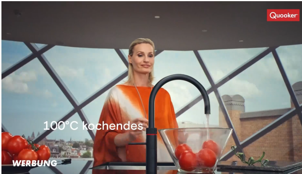
Abbildung 2: Einblendungen „Werbung“ und „Quooker“ während des Sponsorhinweises

Die Einblendung „Werbung“ ist bis ca. 19:21:08 Uhr zu sehen. Der Sponsorhinweis endet um ca. 19:21:10 Uhr mit der Einblendung „Quooker. Mehr Infos auf quooker.at“ (siehe Abbildung 3). Unmittelbar anschließend folgt ein Programmhinweis.