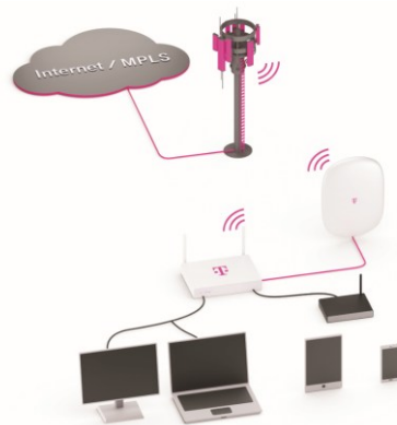
Abbildung 2 - Corporate Mobile Plus (beispielhafte Abbildung)

Folgende Tarife können mit diesem Produkt genutzt werden: